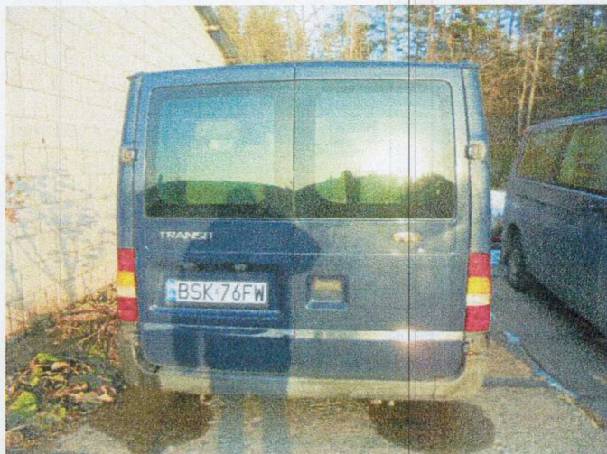
Ogólny widok pojazdu