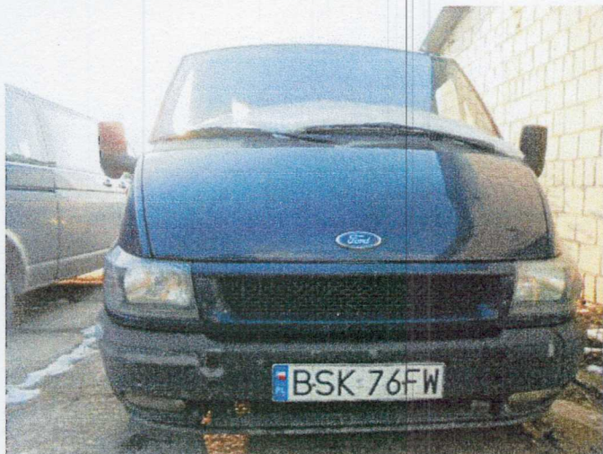
Ogólny widok pojazdu