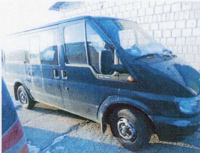
Ogólny widok pojazdu