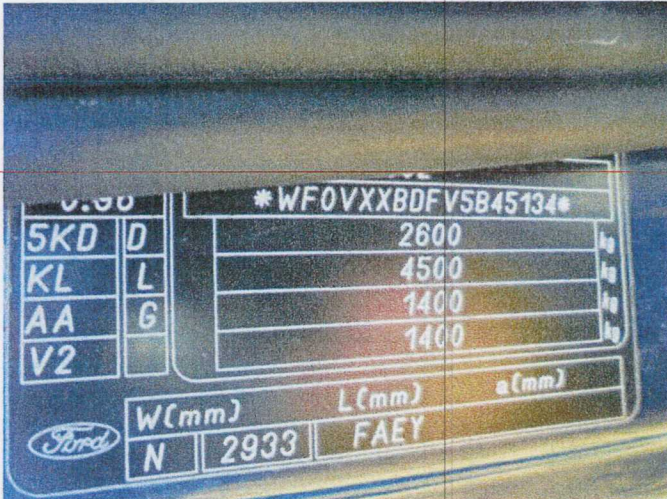
Tabliczka znamionowa pojazdu