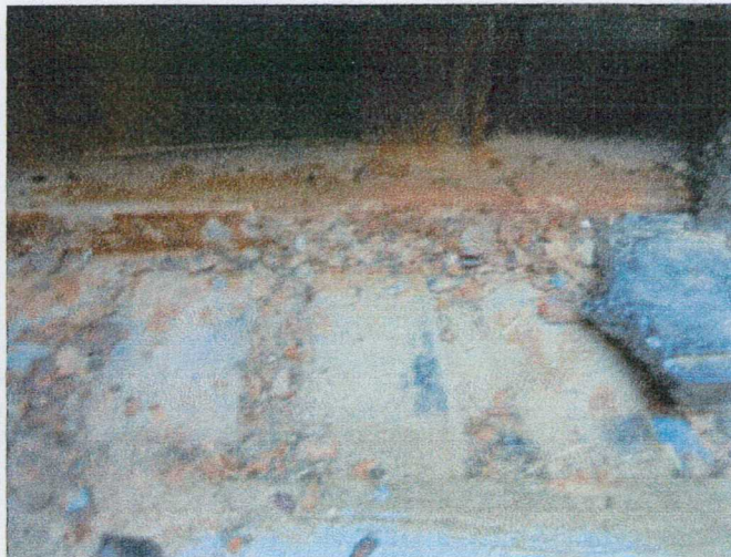
Skorodowane pole numerowe